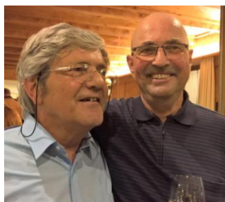
Und anlässlich der Vernissage am 8. November 2017 in Thusis